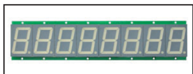
VERSIONE A GIORNO (no container) Dimensioni 385 x 85 x 50 mm (Dimensions)