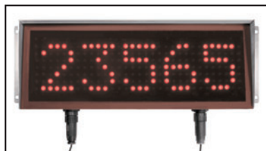
Dimensioni 530 x 185 x 110 mm (Dimensions)