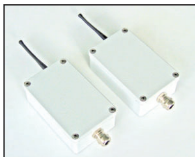
Dimensioni 126 x 79 x h 42 mm (Dimensions)