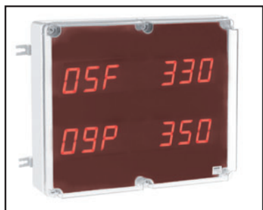
Dimensioni 470 x 390 x 130 mm (Dimensions)