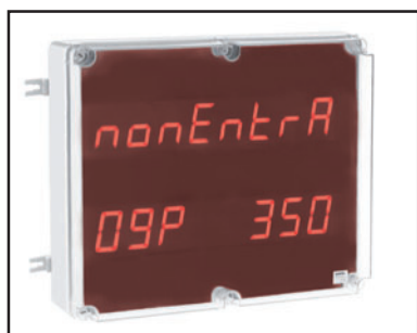
VERSIONE IP56 (waterproof box) Dimensioni 470 x 390 x 130 mm (Dimensions)